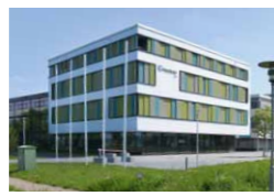
2 Fraunhofer-Institut für Angewandte Polymerforschung (IAP)

Das Technologiespektrum des Institutsteils beinhaltet Bioanalytik und molekulare Diagnostik, Telediagnostik und Bioinformatik, Entwicklung von Lab-On-Chip-Systemen, biofunktionale Oberflächenbeschichtungen, Nanobiotechnologie, Systeme zur zellfreien Proteinsynthese sowie die Extremophilenforschung an kälteadaptierten Organismen.