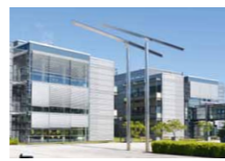
4 Max-Planck-Institut für Molekulare Pflanzenphysiologie

Als „Gedächtnis des Landes Brandenburg“ verwahrt das Brandenburgische Landeshauptarchiv rund 50.000 laufende Meter Urkunden, Akten, Grundbücher, Karten und Fotos aus den Behörden und Einrichtungen des Landes seit dem Mittelalter und macht sie einer breiten Öffentlichkeit zugänglich.