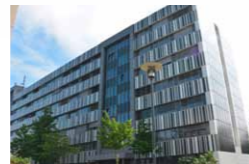
Universität Potsdam 8 Humanwissenschaftliche Fakultät

Das GO:IN bietet optimale Ansiedlungsbedingungen für Unternehmen. Dies sind nicht nur modern und zweckmäßig eingerichtete Labor- und Büroräume, sondern vor allem auch unternehmensnahe Dienstleistungen, individuelle Beratung und die Einbindung in die regionalen Netzwerke.