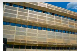
Universität Potsdam 9 Mathematisch-Naturwissenschaftliche Fakultät

Die Forschungsschwerpunkte Handeln und Verhalten, Sprache, Gesundheit, Breiten- und Spitzensport, Schule und Unterricht sowie Lernen über die Lebensspanne repräsentieren die zentralen Inhalte der wissenschaftlichen Ausrichtung der Humanwissenschaftlichen Fakultät.