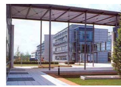
5 Max-Planck-Institut für Kolloid- und Grenzflächenforschung

Das Institut hat sich weltweit einen Namen gemacht in der Erforschung pflanzlicher Stoffwechselfvorgänge und ihrer Regulation. Mit Hilfe neuer am Institut entwickelter Methoden wird das Zusammenspiel von Prozessen untersucht, die das pflanzliche Wachstum bestimmen oder beeinflussen. Unter Verwendung mathematisch/statistischer Verfahren erfolgt die Aufarbeitung und Interpretation der Daten.